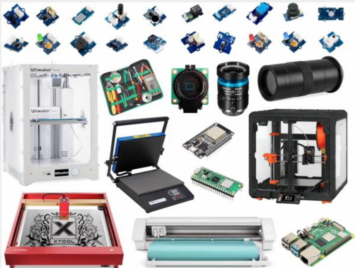
Principaux équipements : capteurs électroniques, outillage et micro-contrôleurs, imprimantes 3D,

Nous organisons ces ateliers et nous installons des FabLab éphémères comme un groupe de musiciens qui se déplacent avec ses instruments et sa sono pour un concert.