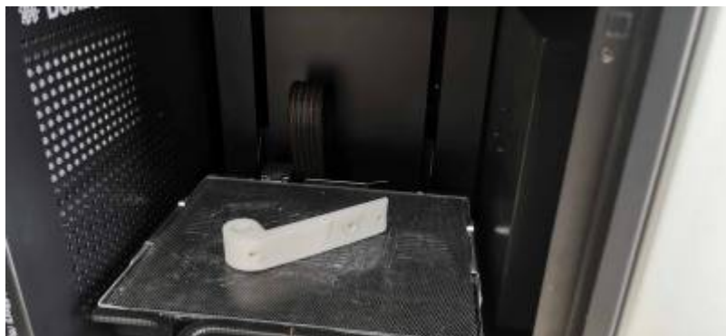
* Impression 3D de penture de porte pour le projet du poulailler automatisé