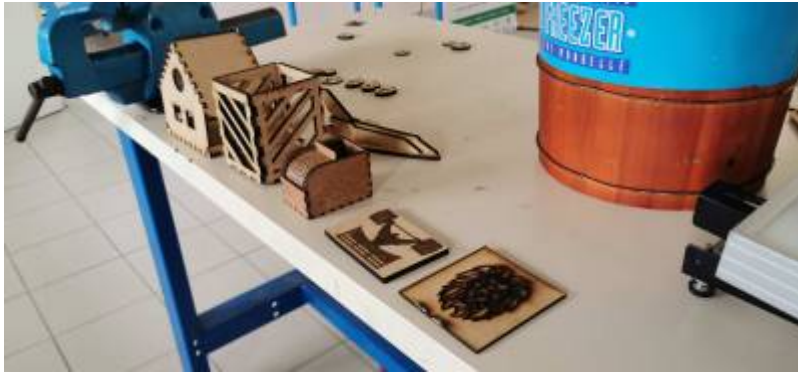
*Differentes réalisations d'élèves en cours d'année (maquettes d'architecture, boites de rangement, gravures d'image, de caricature, maquettes d'architecture, coques de téléphone...)