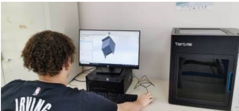
* Modélisation sur solidworks de la "bwèt à krab"