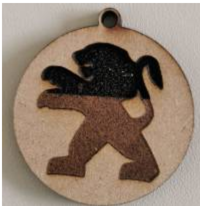
* Confection de porte-clés avec logo du lycée pour la journée porte ouverte aux collèges.