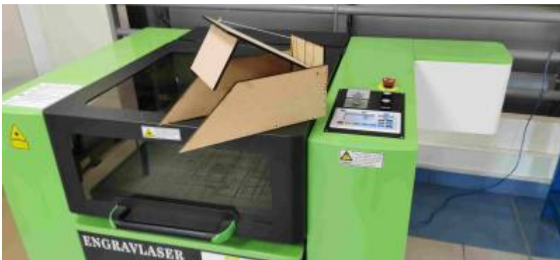
* Réalisation à la découpe laser pour les vacances de pâques