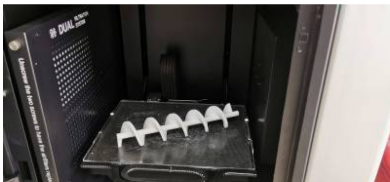
* Impression 3D d'une vis san fin pour la distribution de grain du poulailler automatisé