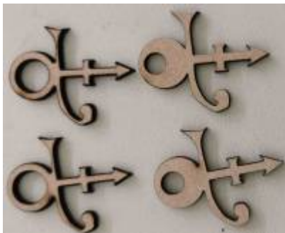
* Confection de boucles d'oreilles pour la fête des mères