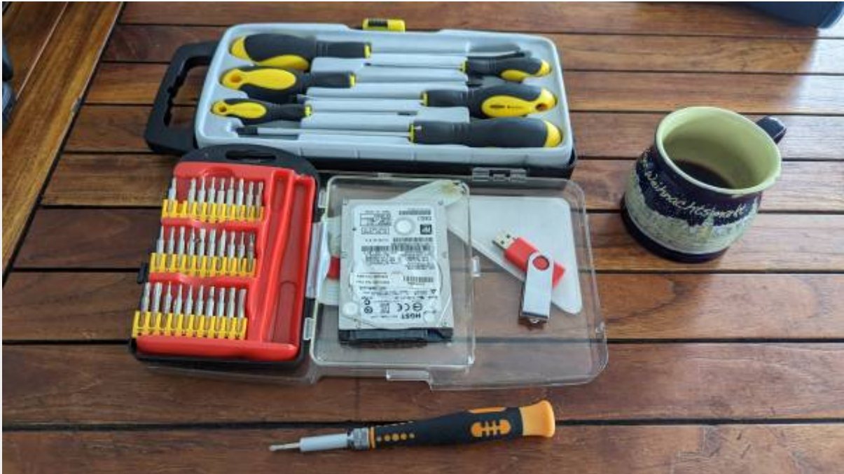
Une clé USB, un nouveau disque dur, des tournevis et un café : on est prêts ...

Il est également souhaitable de disposer d'une connexion internet pour procéder aux mises à jours des logiciels installés et en installer des supplémentaires, non inclus dans une installation standard. Ces opérations peuvent également être effectuées plus tard.